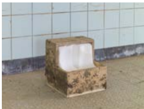
Nicolas Momein, Incomplete Closed Cube, Aliboron l'a digéré , 2011 © Nicolas Momein

Découvrez les autres rendez-vous sur le site biennaledelyon.com/veduta