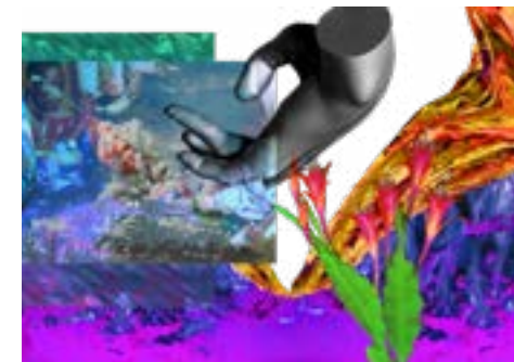
Josèfa Ntjam, Ifa 3.0 Beta , photomontage, 2019

Découvrez les autres rendez-vous sur le site biennaledelyon.com/veduta