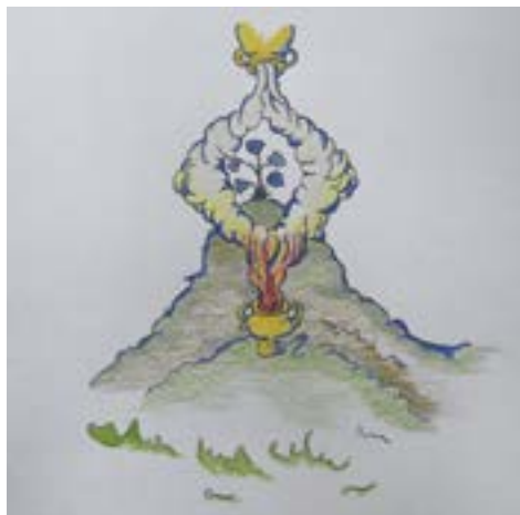
Julieta García Vazquez et Javier Villa, Untitled , 2019 © Julieta García Vazquez et Javier Villa

En collaboration avec Grand Lyon Habitat.