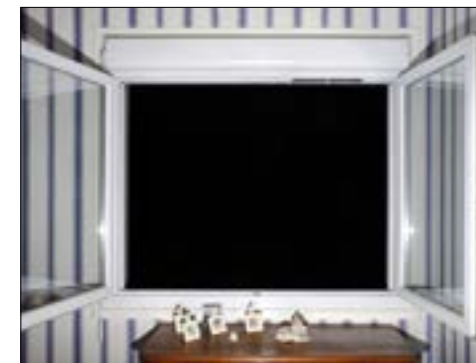
Karim Kal, L'Issue - Rillieux-La-Pape, 2018.

Découvrez les autres rendez-vous sur le site biennaledelyon.com/veduta