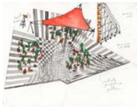
Felipe Arturo, Thoughts of Caffeine , dessin préparatoire pour Rillieux-la-Pape, Lyon, 2018. © Felipe Arturo

Artiste-résident avec le soutien généreux de SAM Art Projects. En collaboration avec la DAAC de Lyon, Dynacité et Serge Ferrari.