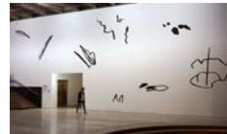
Escif, La Ficción no es delito (Secret Wall) , Palais de Tokyo, Paris, 2018.

Acción Cultural Española (AC/E) soutient le projet de l'artiste espagnol Escif à travers le Programme for the Internationalisation of Spanish Culture (PICE), dans le cadre des bourses de mobilité.