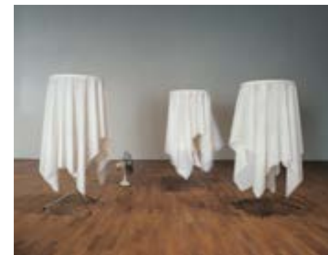
Marinus Boezem, Wind Tables , 1968. Collection macLYON

Découvrez les autres rendez-vous sur le site biennaledelyon.com/veduta