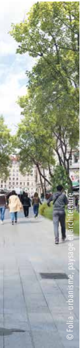
© Folia - urbanisme, paysage et architecture