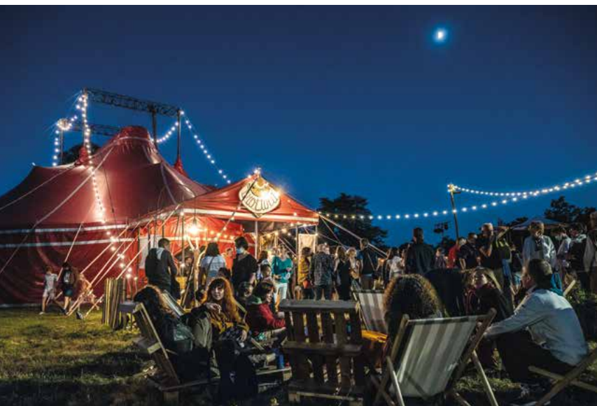
▲ Chaque été, les Nuits de Fourvière installent leur village cirque au domaine de Lacroix-Laval, à Marcy-l'Étoile.