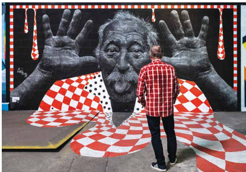
▲ Une œuvre signée Lady Bug présentée sur l'édition 2021.

Halle Debourg - De 4 à 5 euros - Informations sur peinturefraichefestival.fr