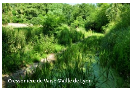
Cressonnière de Vaise

Sam. et dim. de 10h à 11h30. Réservation obligatoire.