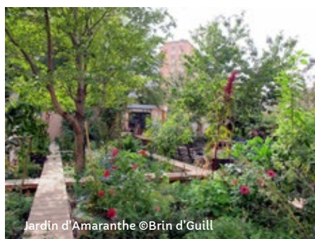
Jardin d'Amaranthe