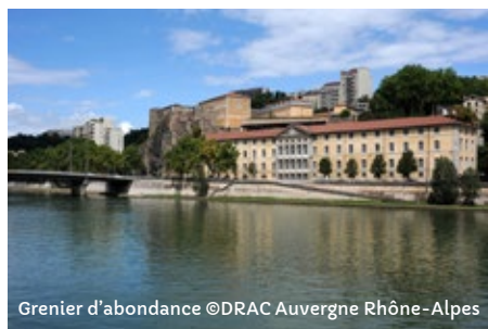
Grenier d'abondance